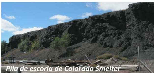
Pila de escoria de Colorado Smelter

La Agencia de Protección Ambiental de los Estados Unidos (Environmental Protection Agency, EPA) ha analizado algunos de los terrenos de los vecindarios posiblemente perjudicados por las históricas operaciones de fundición cerca de la fundición Colorado Smelter en el vecindario Eilers de Pueblo. Algunas muestras superan los niveles federales de salud en cuanto a arsénico y plomo. Es necesario investigar más para entender mejor el alcance de la contaminación. A menudo, las operaciones y emisiones históricas a causa de la fundición dejan restos de metales pesados, incluso arsénico y plomo, en los suelos. También queda abandonada una “pila de escoria”, el área de material rocoso de gris a negro ubicada entre la I-25 y Santa Fe.